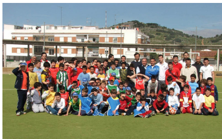
El clinic fue un éxito de participación