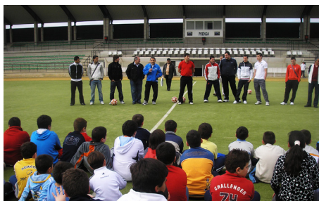
Niños y monitores participantes en el clinic