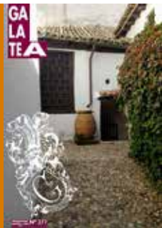
Rincón pintoresco de la Casa-museo de Cervantes en el que se aprecian las entradas a la cueva y a la bodega, el palomar y la recogida de agua de lluvia.