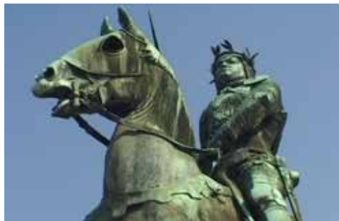
Detalle de la estatua ecuestre de Bertrand Du Guesclin (1314-1380) en la plaza de Dinan, bonita ciudad francesa en Bretaña.

Para los tiempos que vivimos hay dos formas de codicia que se practican sin recato: la codicia de riquezas y la codicia de poder. Ambas son muy viejas y, nuevamente, la Biblia nos ilustra sobre ellas. En el Libro de Josué (7, 1-24), Acán es lapidado por apropiarse de objetos dados al anatema (exvotos en los muros de los templos) y esconderlos en su tienda movido por la codicia. En 1 Reyes (21, 1-19) se refiere la historia de “La viña de Nabot”. Al negarse Nabot a vender su viña al rey Ajab, Jezabel su esposa logra que se acuse falsamente a Nabot que fue lapidado y Ajab se apoderó de la viña. Pero la codicia es